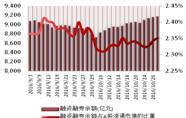
图 2：近三十个交易日融资融券余额及占 A 股流通市值的比重