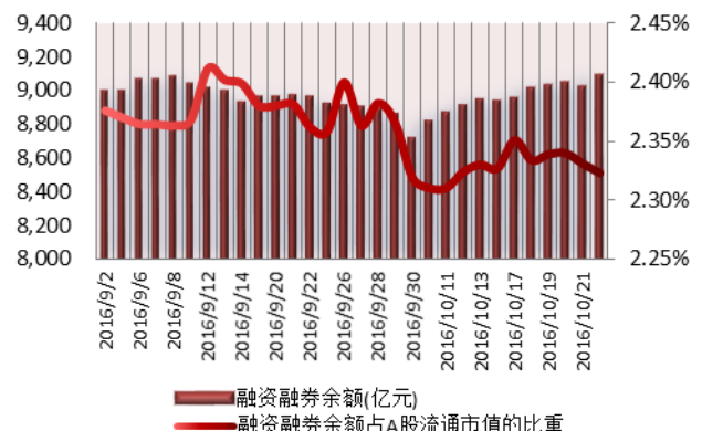
图 2：近三十个交易日融资融券余额及占 A 股流通市值的比重